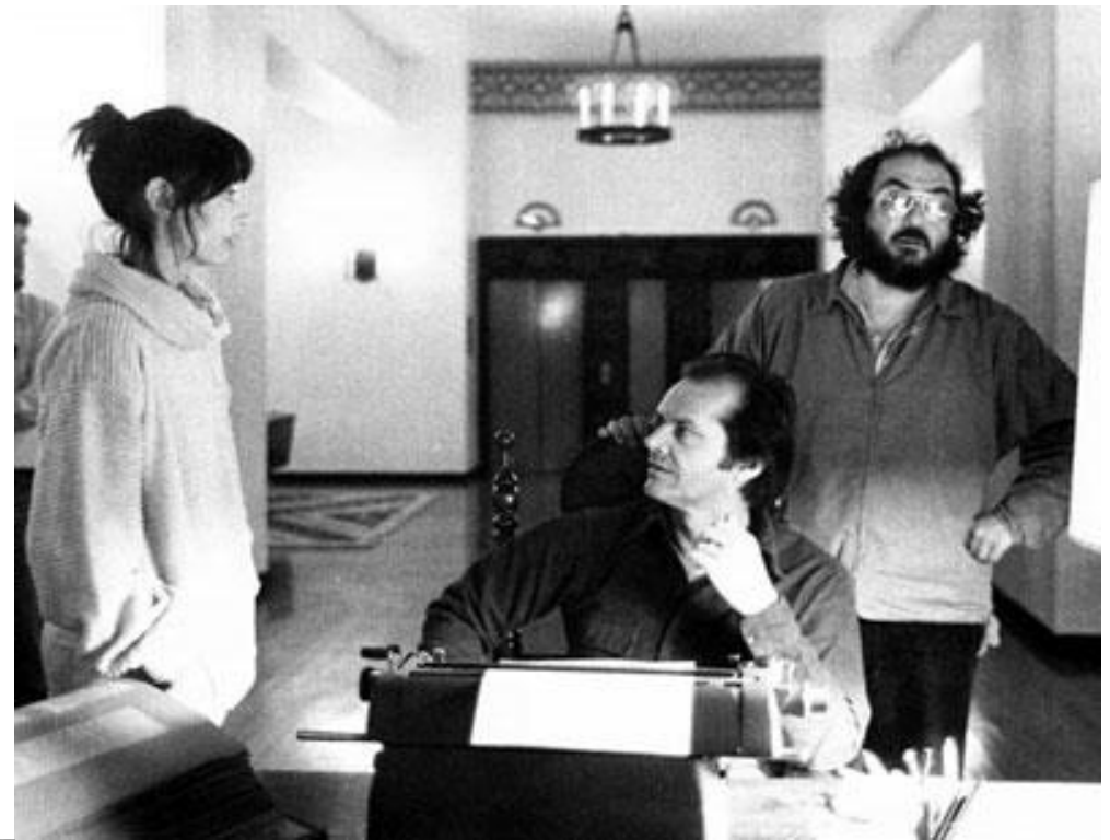
Shelley Duvall, Jack Nicholson e Stanley Kubrick, tratto da "Shining"