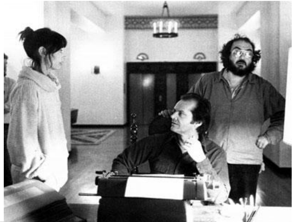
Shelley Duvall, Jack Nicholson e Stanley Kubrick, tratto da "Shining"